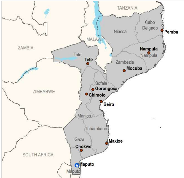
Fonte: FEWS NET agradece ao Sistema de Informação de Mercados Agrários (SIMA) da Direcção de Cooperação e Mercados (DCM) do Ministério da Agricultura e Desenvolvimento Rural (MADER) da República de Moçambique, pelos dados e informações usados

A Rede dos Sistemas de Aviso Prévio contra Fome monitora as tendências dos preços dos alimentos básicos nos países mais vulneráveis à insegurança alimentar. Para cada país e região da FEWS NET, o Boletim sobre os Preços fornece um conjunto de gráficos que mostram a variação mensal dos preços durante o ano comercial em curso em determinados centros urbanos, permitindo aos usuários comparar as tendências actuais, com ambas a média de cinco anos, indicativo de tendências sazonais, e os preços no ano anterior.