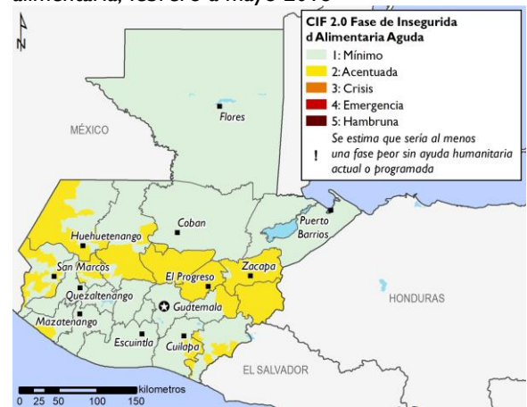
Figura 2. Resultados proyectados de seguridad alimentaria, febrero a mayo 2018